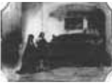
(201) Graftombe van Jan III van Polanen in de Grote Kerk te Breda albumbladje, 7x9,5 cm, gesigineerd r.o.: J. Bosboom part. bezit