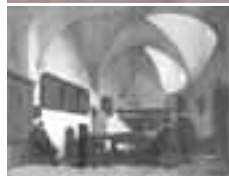
(302) Consistoriekamer in de Grote Kerk te Breda olieverf op paneel, 25x32 cm, gesigneerd part. bezit