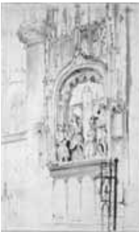
3. Studieblad met het monument van Engelbrecht I (008)

Tenslotte, zo bleek hierboven al even, was Bosboom een befaamd carpiccionist, die onderdelen uit verschillende kerken zonder gêne samenvoegde tot een acceptabel interieur en onderdelen in een kerk terwille van de compositie verplaatste naar een andere positie op zijn schilderij, zoals in het geval van zijn De Onze Lieve Vrouwekerk te Breda met het grafmonument van Engelbrecht II van Nassau . 13