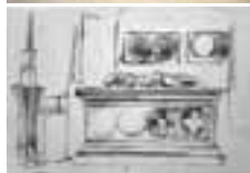
(204) Grafombe van Jan III van Polanen penseel in bruin, 12,1x18,7 cm. Rijksprentenkabinet Amsterdam, inv.nr. RPT-1996-121