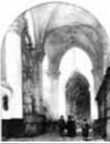
(005) Grote Kerk te Breda met grafombe van Engelbrecht I en Jan IV van Nassau penseel in kleur, 51x37 cm, afgeronde bovenzijde, gesigneerd r.o.: Breda Bosboom part. bezit.