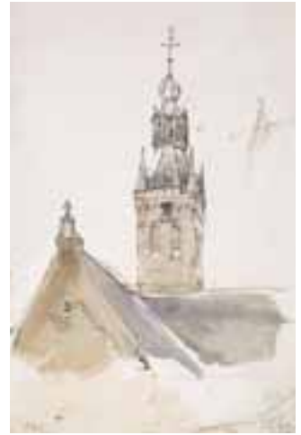
15. Toren van de Markendaalse kerk, aquarel (501)

werd gemeld van de grafkelder van een bisschop, te voorschijn gekomen bij de sloop van de oude kruiskerk Merkendaal, aan de Haven te Breda. 20 In de Bredasche Courant van 14 oktober van hetzelfde jaar stond een advertentie voor de publieke verkoping van sloopmateriaal grootendeels afkomstig van het Kerkgebouw Het Markendaal . 21 Bosbooms werken van de Markendaalse kerk dateren dus in ieder geval van vóór 1849, maar waarschijnlijker is dat ze zijn ontstaan in dezelfde tijd als bovengenoemd albumblaadje: 1837. In 1841 werd de sterk in verval geraakte kerk als pakhuis verhuurd en een jaar later verkocht aan de aannemer Pieter van Riel, waarna er tot 1847 regelmatig allerlei aanbouwsels van de kerk werden gesloopt. Op Bosbooms tekening maakt de kerk nog niet de indruk in gebruik te zijn als pakhuis.