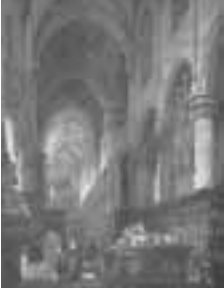
(011)Gezicht in de St. Catharinakerk te Hoogstraten met het monument van Engelbrecht I penseel in kleur, afm. onbekend part. bezit (overhuiving van de koorbanken, tekstborden en achterzijde van Engelbrecht I uit Breda)