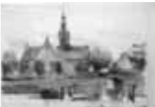
(403) Markendaalse kerk te Breda zwart krijt, in schetsboek, 11,8x20,3 cm Rijksprentenkabinet Amsterdam, inv.nr. RPT-1996-117, p.8

Afbeeldingen en bronnen, voorzover niet elders vermeld: