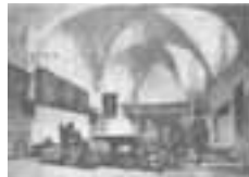
(303) Consistoriekamer in de Grote Kerk te Breda penseel in kleur, 28x37 cm, gesigneerd r.o.: Bosboom part. bezit