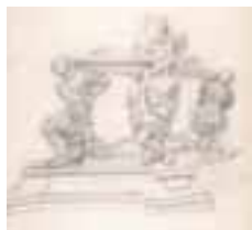
(106) Grafmonument van Engelbrecht II potlood en zwart krijt, gesigeneerd en gedateerd: Breda 1843 J. Bosboom KUB, Tilburg, Brabantcollectie, inv.nr. B83/51.22/22.2b.11