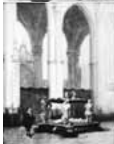
(108) Grafmonument van Engelbrecht II in de Grote Kerk te Breda olieverf op paneel, 15x11,5 cm, gesigeneerd en gedateerd l.o.: J. Bosboom 1885 Gemeentemuseum, Arnhem, inv.nr. GM 2091 (gestolen 20-12-1970)