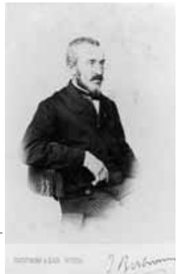
25. Johannes Bosboom, 1865