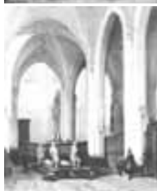
(109) Grafmonument van Engelbrecht II in de Grote Kerk te Breda penseel in kleur, 27x21 cm, gesigeneerd m.o.: J. Bosboom part. bezit