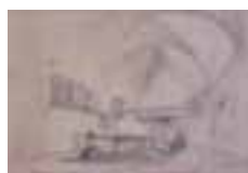
(301) Consistoriekamer in de Grote Kerk te Breda penseel in kleur, 39x54 cm, gesigneerd: J.B. Gemeente Breda, Beyerdcollectie