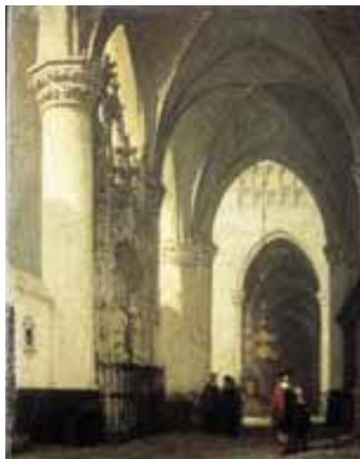
2. Noordelijke kooromgang met het monument van Engelbrecht I en Jan IV van Nassau

nen voor restauratie raakten in het slop doordat de koning ziek werd en in 1849 te Tilburg overleed. Tien jaar later kwam het er op initiatief van het Ministerie van Binnenlandse Zaken wel van tot restauratie over te gaan, welke werd uitgevoerd onder leiding van de nog jonge P.J.H. Cuypers. Publicaties van J. Alberdingk Thijm, een zwager van Cuypers, bezorgden het monument en de restauratie ervan behoorlijk wat publiciteit. 4 De andere monumenten in de Grote Kerk bieden tegenwoordig helaas een verwaarloosde aanblik, vooral die van Jan II en Jan III van Polanen. Zij verdienen een beter lot.