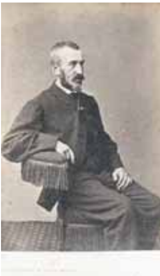
24. Johannes Bosboom, 1865