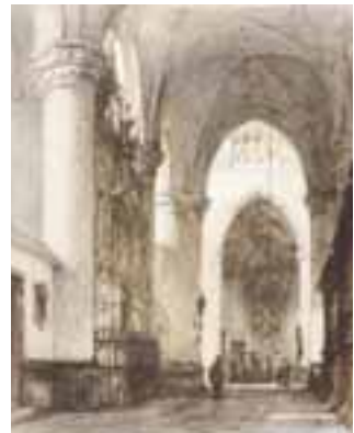
2. Noordelijke kooromgang, aquarel (003)

afsluit van de kooromgang, een detail met de consoles aan de bovenzijde van dit hek en een detail van een monument met vierpassen. 16