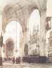
(010)Eusebiuskerk te Arnhem met monument van Engelbrecht I uit Breda penseel in kleur, 37x47 cm, gesigneerd en gedateerd l.o.: J. Bosboom A° 1852 part. bezit (zie 009)