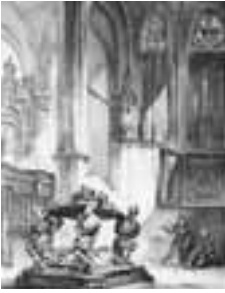
(111) Grafmonument van Engelbrecht II in de Grote Kerk te Breda litho, 29x22,7 cm, Chimaer van Oudendorp naar Bosboom, Chimaer del. , Lith. Soetens&Fils. Breda's Museum, inv.nr. ST 176