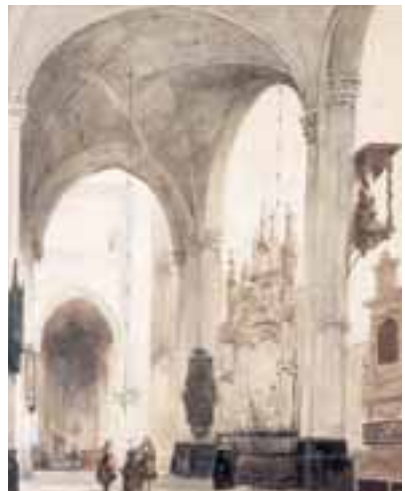
4. Eusebiuskerk te Arnhem met het monument van Engelbrecht I uit Breda, 1851 (009)