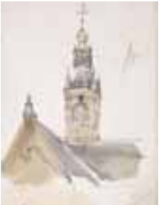
(401) Toren van de Markendaalse kerk te Breda penseel in kleur r, 42,7x28,5 cm, gesigneerd r.o.: J. Bosb. part. bezit