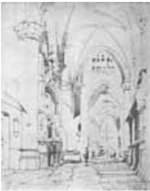
7. Noordelijke kooromgang, penseeltekening (002)