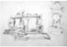
(113) Grafmonument van Engelbrecht II en epitaaf van Assendelft potlood in schetsboek, 11,8x20,3 cm Rijksprentenkabinet Amsterdam, inv.nr. RPT-1996-117-p.9