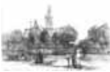
(402) Markendaalse kerk te Breda zwart krijt, 38x56 cm, gesigneerd l.o.: Breda Bosboom verblijfplaats onbekend