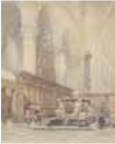
(114) Grafmonument van Engelbrecht II in de Grote Kerk te Breda penseel in kleur, 49,7x39,9 cm, gesigineerd r.o.: 'Bosboom' en 'Breda' Breda's Museum.