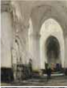
(006) Grote Kerk te Breda met grafombe van Engelbrecht I en Jan IV van Nassau olieverf op doek, 43x33,5 cm, niet gesigneerd uit part. bezit geveild bij Glerum 25 april 2001