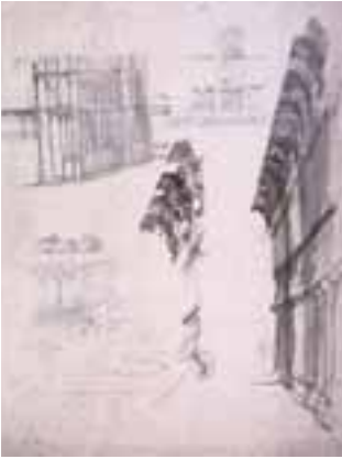
5. Studieblad met details uit de Grote Kerk te Breda, ca. 1843 (001)