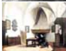
(305) Consistoriekamer in de Grote Kerk te Breda olieverf op paneel, 37,5x45,5 cm part. bezit