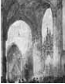
(007) Eusebiuskerk te Arnhem met monument van Engelbrecht I uit Breda penseel in kleur, 17x12 cm. part. bezit