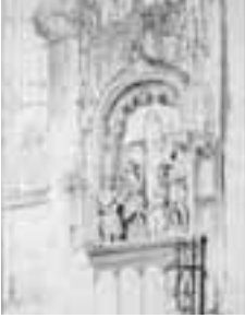
(008) Monument van Engelbrecht I in de Grote Kerk te Breda pen en penseel in grijs en groen, 34x21 cm. Rijksprentenkabinet Amsterdam, inv.nr. RPT-1949-1