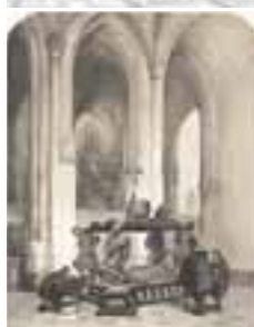
(110) Grafmonument van Engelbrecht II in de Grote Kerk te Breda litho, 21,5x15,7 cm, Weissenbruch naar Bosboom, J. Bosboom del., F.H. Weissenbruch Dz lith. druk: C.W. Meiling Breda's Museum, inv.nr. ST 5143