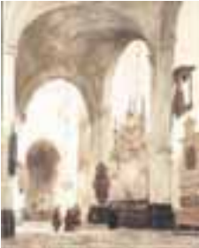
(009) Eusebiuskerk te Arnhem met monument van Engelbrecht I uit Breda penseel in kleur, 47,5x37,5 cm, gesigneerd en gedateerd l.o.: J. Bosboom A° 1851 Koninklijke Verzamelingen, inv.nr. AT/190 (grote overeenkomsten met 010, maar niet identiek)