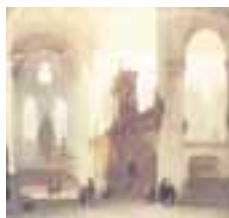
(203) Grote Kerk te Delft met grafombe van Jan III van Polanen uit Breda olieverf op linnen, 140x150 cm, gesigneerd en gedateerd; J. Bosboom 1848