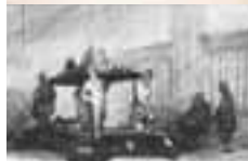
(107) Grafmonument van Engelbrecht II in de Grote Kerk te Breda potlood en penseel, gedateerd l.o.: 1843 part. bezit