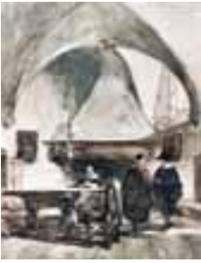
(306) Consistoriekamer in de Grote Kerk te Breda penseel in kleur part. bezit