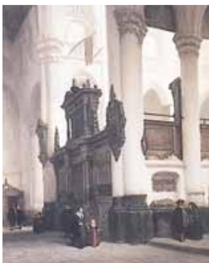
13. Grote Kerk te Delft met in de kooromgang de grafombe van Jan III uit Breda (202)

een albumbladje met een schets van een tweetal figuren bij het grafmonument van Jan III (als heer van Breda: Jan II) van Polanen. Bosboom gebruikte de schets voor een paneelschilderij van de Nieuwe Kerk in Delft dat hij vervaardigde in 1843. Hij plaatste het grafmonument van Jan III van Polanen uit Breda aan de buitenzijde van de zuidelijke koorafdeling van de kerk in Delft: een element uit de vroegere Nassaukerk wordt opgenomen in de huidige.