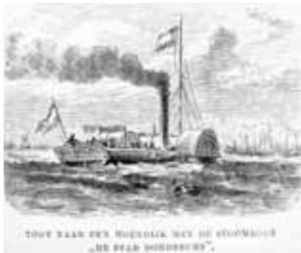
9. Een stoomraderboor onderhield de verbinding tussen Rotterdam en Moerdijk