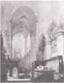
(012)Gezicht in de St. Catharinakerk te Hoogstraten penseel in bruin, 27x18 cm part. bezit (overhuiving van de koorbanken en achterzijde van Engelbrecht I uit Breda)