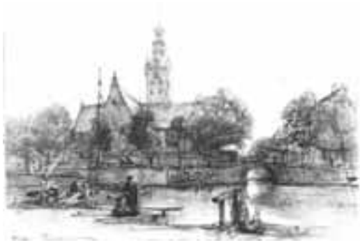
14. Markendaalse kerk aan de Prinsenkade gezien vanaf de Haven (502)