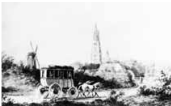
10. Zo kan Bosboom de Grote Kerk van Breda hebben gezien als hij per postkoets de stad naderde

Roosendaal werd, op particulier Belgisch initiatief, geopend in 1854. Kort daarop werd deze lijn doorgetrokken naar Moerdijk en werd een zijtak aangelegd naar Etten-Leur. Breda was per spoor bereikbaar vanaf 1855 toen de Belgische maatschappij Grand Central Belge, die de lijn vanuit Antwerpen exploiteerde, hier het eerste stationnetje opende. Drie maal per dag reed er een trein. De diligenceverbinding tussen Breda en Moerdijk verdween bijna onmiddellijk. Vanaf 1863 was Breda door een spoorlijn verbonden met Tilburg en verder. De Moerdijkbrug, die een vaste en ononderbroken treinverbinding met Rotterdam mogelijk maakte werd in gebruik genomen op 1 januari 1872, maar pas op 1 mei 1877 was het laatste baanvak Mallegat (bij Dordrecht) naar Rotterdam voltooid.