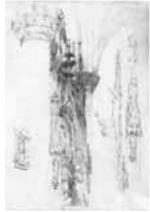
6. Studieblad met het monument van Engelbrecht I (013)