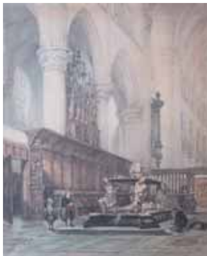
17. Interieur van de Grote Kerk te Breda, aquarel (113)