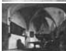
(304) Consistoriekamer in de Grote Kerk te Breda penseel in kleur, 25x32 cm. verblijfplaats onbekend