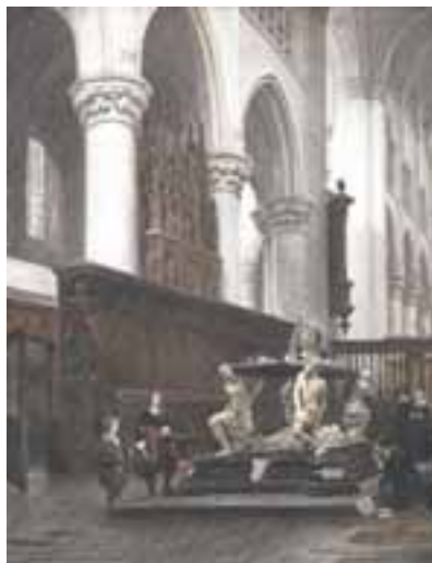
16. Interieur van de Grote Kerk met het grafmonument van Engelbrecht II in het hoogkoor en het monument van Engelbrecht I in de zuidelijke kooromgang, olie- verf, 1843 (001)