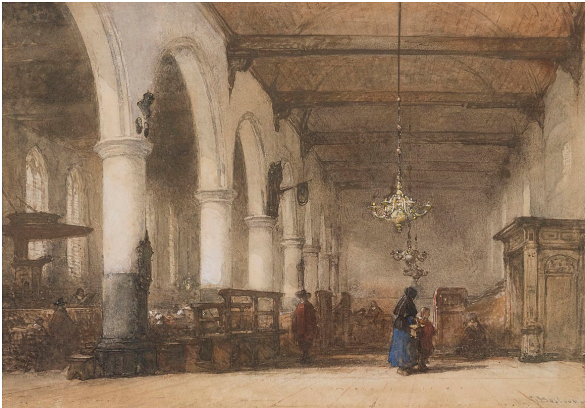
Afbeelding 7: Bakenesserkerk in Haarlem: (Olieverf) Afmeting (mm): 245x322