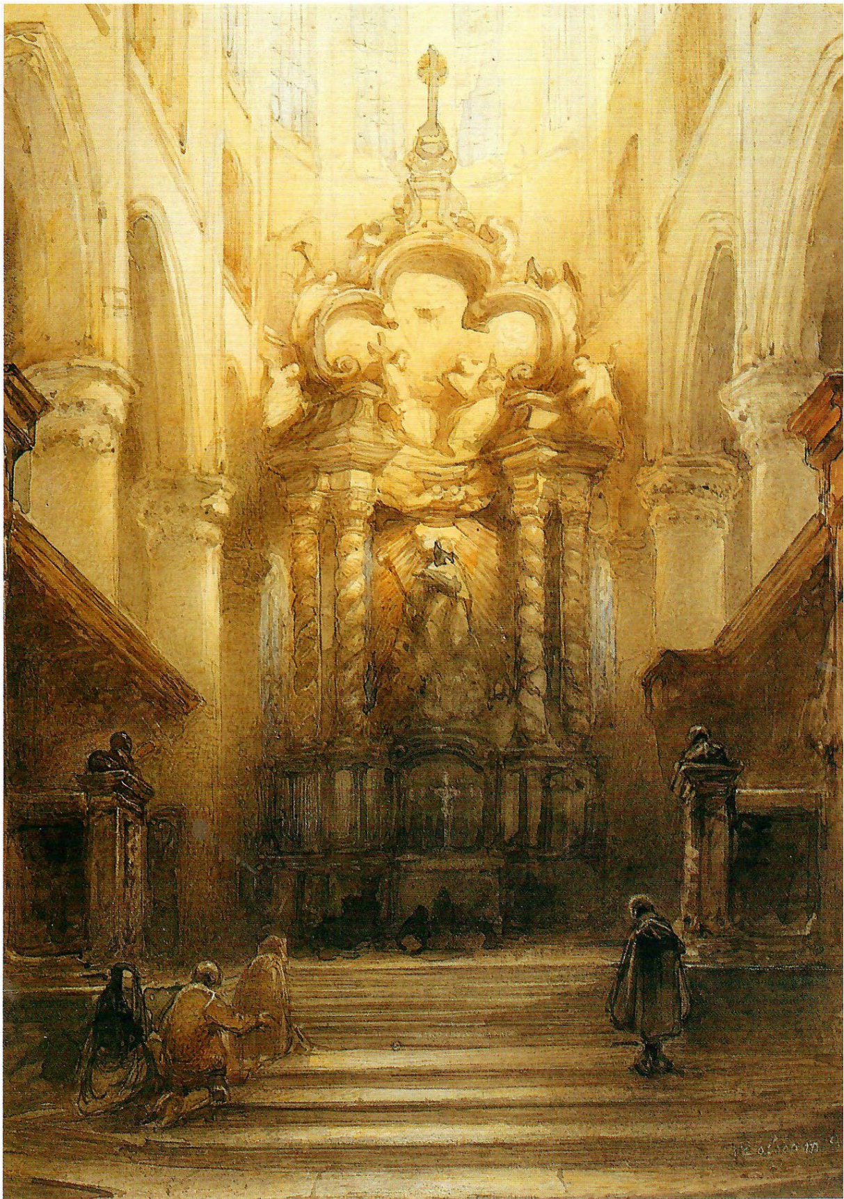
Afbeelding 1: Sint-Jacobskerk Antwerpen: Lux in Tenebris. (Aquarel) Afmeting (mm) 275x195